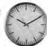
Tijd & plaats